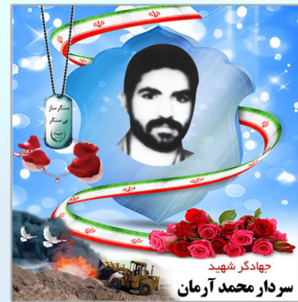
شهید سردار محمد آرمان

هنوز مدت زیادی از ازدواجمان نگذشته بود که به شدت مجروح شد و به پشت جبهه برگشت، پدرم می گوید: ساعت دو شب بود که دیدم یک نفر در منزل را می کوبد. وقتی در را باز کردم، دیدم یک لندکروز سپاه