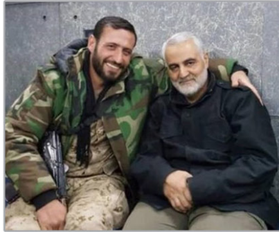
شهید هادی طارمی

تلفن گویا انتقادات و شکایات ۰۳۴ - ۳۲۶۱۳۱۹۹