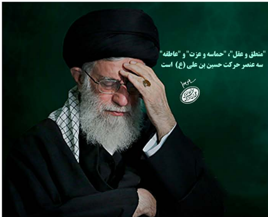
"منطق و عقل"، "حماسه و عزت" و "عاطفه" سه عنصر حرکت حسین بن علی (ع) است